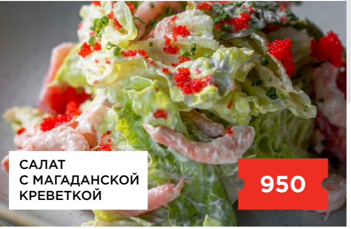
САЛАТ С МАГАДАНСКОЙ КРЕВЕТКОЙ

Оливье с языком и красной икрой ..... 750 Салат с ростбифом ..... 890