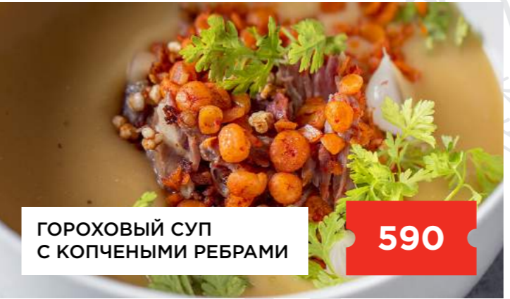
ГОРОХОВЫЙ СУП С КОПЧЕНЫМИ РЕБРАМИ

Фирменная солянка с креветками ..... 550 Борщ с телячьими щечками и языком ..... 650