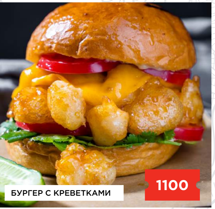
БУРГЕР С КРЕВЕТКАМИ