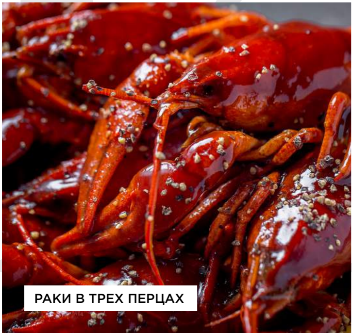
РАКИ В ТРЕХ ПЕРЦАХ